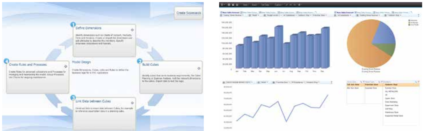
Figure 2 : Cognos Express est un environnement de budgétisation et de planification puissant et facile d'emploi accessible sur votre PC et sur des périphériques mobiles.

Cognos Express vous aide à guider le processus de pilotage de la performance en permettant aux responsables financiers et de gamme d'activité d'affecter des responsabilités fonctionnelles aux individus ou aux groupes. Les collaborateurs soumettent les données en respectant le planning, et les tâches sont signalisées comme non démarrées, en cours, approuvées, refusées ou non déléguées. Les réviseurs surveillent la progression et acceptent ou rejettent les contributions si nécessaire. Cognos Express rend extrêmement visible toute le processus de pilotage de la performance et améliore la rapidité et l'imputation des responsabilités.